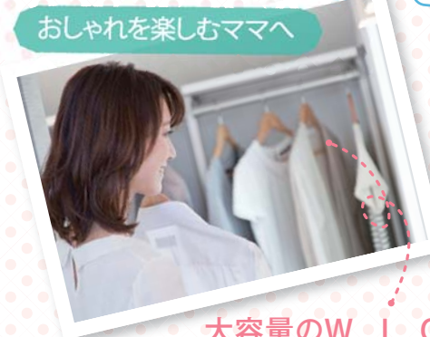
大容量のW.I.C 洋服をたくさん持っている奥様に嬉しいW.I.Cは収納力も豊富なので大変便利です。