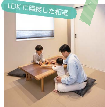
子育て中も遊びにお昼寝に大活躍！