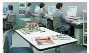
建てる前に一棟一棟緻密な構造計算 一棟ごとに388項目*におよぶ構造計算を実施。強固な構造体により大空間を実現します。 ※多量区域は440項目