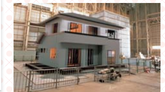
実物大振動実験で震度7をクリア 震度7相当の揺れを5回に達して加える実物大振動実験をクリアし、高い構造強度を立証。