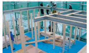
パナソニックビルダースグループによる責任施工

一般的な木造接合金具と比べ、約3倍の引き抜き強度を誇る*「ドリフトピン接合」を採用。 ※「木造軸組工法住宅の許容応力度設計(平成20年度)」に準拠