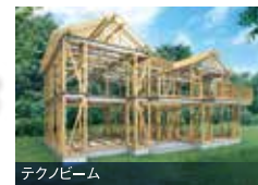
テクノビーム 木と鉄の複合梁「テクノビーム」で 木造住宅を強化