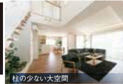
柱の少ない大空間 しっかりした骨組みにより ひろびろとした大空間を実現

Panasonic builders group | パナソニックビルダースグループ