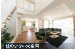
柱の少ない大空間

388項目※の緻密な構造計算で 耐震性・耐久性をシミュレーション ※多雪区域は440項目。